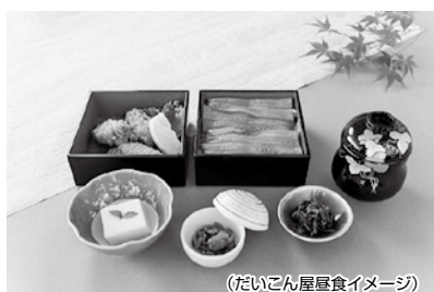
(だいこん屋昼食イメージ)