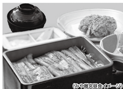
(みや離宮昼食イメージ)