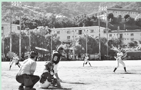
【小学生ソフトボール大会の様子】