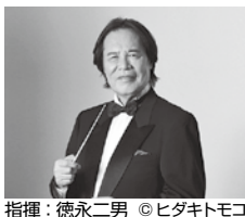
指揮: 徳永二男

※未就学児童は入場不可 有料託児室有(事前申込制 締切7月11日(金)) ひとりにつき500円