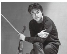
ヴァイオリン: 郷古 廉