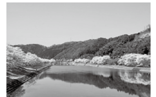
三刀屋川河川敷の桜