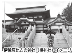
伊豫豆比古命神社(椿神社)イメージ

☆募集人員 20名程度(先着) ☆設定日 2021年1月8日(金)・20日(水)・24日(日) ☆会員旅行代金 おとなお1人 (往復乗船料・バス代・宿泊代(1泊2食)・石手寺入山料・税金・サービス料含む)